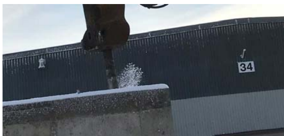
Fastigheten börjar rivas.

Avseende byggnationen i kvarter Luftseglaren II pågår här mark och spontarbeten från RA Byggs sida. Amhult 2 har i detta arbete rivit en av de gamla byggnaderna på granntomten för att bereda plats för etableringsyta. Ni ser i nedan bilder från rivningen och resterna av en äldre fastighet som nu är borta.