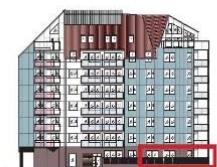
Fasad mot nordväst