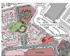
Översikt med lägenhetens placering.