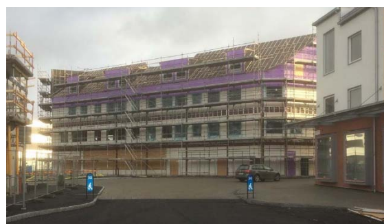
Gata som leder förbi kv. Radarflyget, Stridsflyget och Signalflyget, med Stridsflyget i förgrunden.