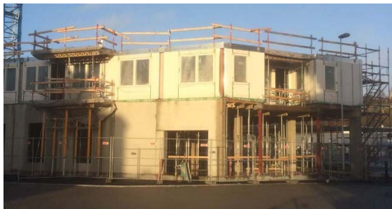
Signalflyget 1 i slutet av december 2015.

Avseende produktionen i Signalflyget 1 (kvarter N) är bjälklag plan två gjutet och klart och återfyllning mot källarväggar samt förläggning dränering klart. Svetsning av dubbar plan två pågår.