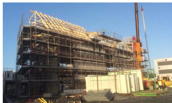
Takmontage Kv. Stridsflyget.

I kvarter Stridsflyget (O) är montage av smidesstomme och montage av HDF plan fyra genomfört. Takstommen är monterad och man kan nu se hur huset kommer att gestalta sig. Västbygg har nu totalt 20 medarbetare på byggarbetsplatsen N samt O.