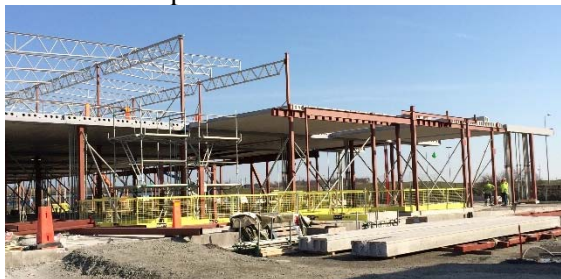
Radarflyget i mars 2015

Att rapportera för perioden är förstas att fullständig slutbesiktning av hus P, Radarflyget skedde den 29 mars 2016, där nu även saluhallsdelen är färdigställd. Det arbetas intensivt på insidan från Axfoods sida med att flytta in i butiken och bygga varulager. På utsidan sker markarbeten och parkeringsytor färdigställs inför öppningen i slutet av april. Det är alltid roligt med en liten jämförelse från föregående år i mars, då stommontaget pågick som bäst på fastigheten, se bilderna nedan. Det händer en del på ett år!