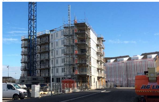
Signalflyget 1 i mars 2016.

Byggnationen av kvarter Signalflyget 1 tuffar på i god ordning och nu kan man verkligen se hur husets volym tar plats i området. Kvarteret är det hus som i vår etapp kommer att utmärka sig med sina våningsplan och bli en motpol till huset Vingen som syns på norrsidan av Amhult Centrum.