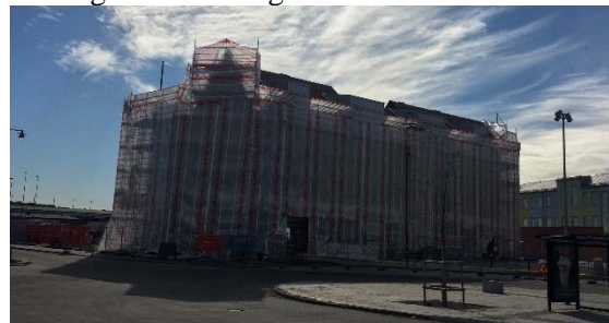
Stridflyget i mars 2016.

Betr. kvarter O, Stridflyget pågår här på plan 4 diverse gipsarbeten och installationer. På plan 1-3 pågår målning. Murning av fasaden är klar och nu pågår putsarbeten utsida. I restaurangen monteras undertaken. Vi ser fram emot vårt övertagande av fastigheten till sommaren.